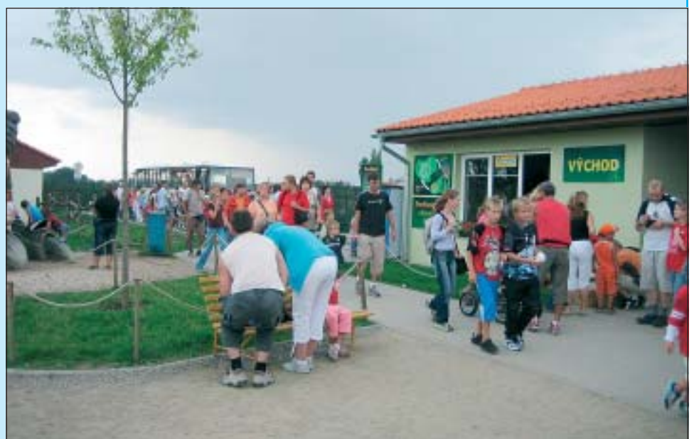
Nástupní prostory pro dopravu do Dinoparku

Především pro staronové návštěvníky bude změnou nové řešení nástupu a výstupu při přepravě do DinoParku a také v DinoParku při přepravě zpět do zoo. Po minulých zkušenostech, kdy zde docházelo k tlačenicím a předbírání, jsme stavebně upravili nástupišť tak, aby byl výstup a nástup oddělen a tvořila se fronta formou haudu, aby nebylo možné předbíhat. Na obou místech dbejte, prosím, pokynů obsluhy a dbejte o bezpečnost především Vašich dětí. K přepravě budou i nadále sloužit dva dinovláčky AVAL a autobusy jako posily. Rádi bychom časem zakoupili ještě třetí soupravu AVAL, neboť víme, že jízda v nich je velice oblíbená nejen u dětí, ale vše záleží, jak jinak, na našich finančních možnostech. Doufáme také, že už skončí nekonečné diskuze nad jejich provozem, neboť doprava probíhá bez problémů a z naší strany jsou splněny veškeré nutné náležitosti a podmínky. Takže – i v tomto roce opět dinovláčky a navíc v klidnější atmosféře.