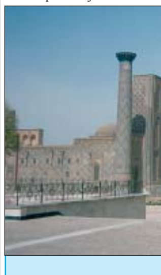
Náměstí Registan v Samarkandu

světového kulturního dědictví UNESCO. Náměstí je tvořeno třemi medresami – Shir Dor, Ulugh Begova a Tillya Kori. Naprostým unikátem je ale medresa Shir Dor, která je na svém portále vyzdobena vyobrazením lva, nebo možná tygra, přestože se v islámském světě nesmí zobrazovat živé bytosti. To pouze Allah smí znát jejich tvar a podobu. Ani jedna z medres neslouží dnes již svému původnímu účelu, tedy jako islámské školy. Požívají se jako galerie, prodejny suvenýrů, nebo prostory pro ukázkou tradičních řemesel, hudby a uzbeckých lidových tanců.