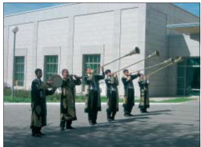
Zahájení konference EARAZA v Taškentu

Náš pobyt v Uzbekistánu se při spoustě různých zážitků překotně krátil a najednou zde byl den odletu zpět do Taškentu a přes Moskvu do Prahy. Cesta do Uzbekistánu pro nás byla přínosem nejen účastí na konferenci EARAZA, ale obohatil nás také o poznání nové kultury a doufáme, že budeme moci využít poznatky z mnoha setkání s tamními lidmi na vsích i ve městech pro naši práci s domácími zvířaty z celého světa.