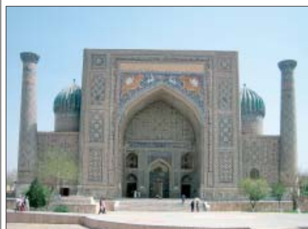
Medresa Shir Dor v Samarkandu

Součástí pobytu v Buchaře bylo několik denních, ale i nočních výjezdů do pouštního Ekologického centra Džež-