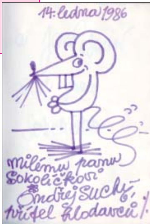
Zápis Ondřeje Suchého