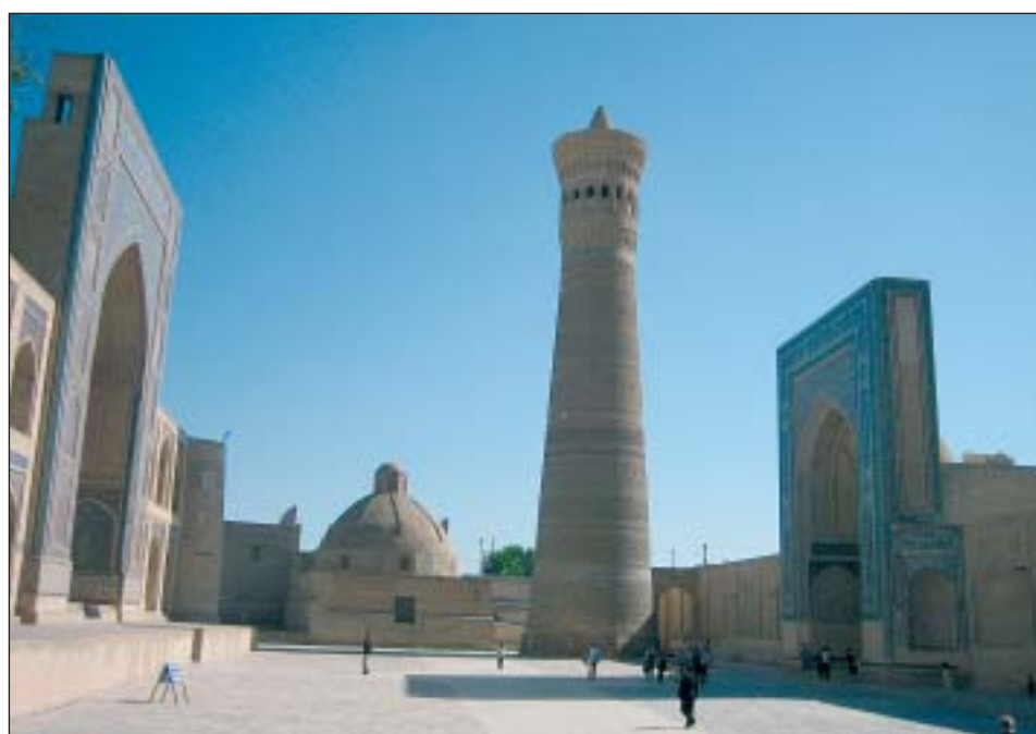
Náměstí Kajlan v Buchaře

Samarkand se koncem 14. století stal hlavním městem obrovské Timurovy říše a dnes je druhým největším městem Uzbekistánu. V roce 329 př.n.l. byl krásou Samarkandu, tehdy se jmenoval Marakanda, unesen sám Alexandr Veliký, ale teprve Čingischán na rozdíl od předchozích dobyvatelů město zničil, a proto muselo být v průběhu 14. až 17. století znovu postaveno. Samarkand se může podle mnohých pyšnit nejkrásnějším náměstím na světě. Nazývá se Registan a zcela právem je zařazen do